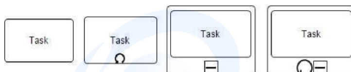
Gambar 1. Element Start, Intermadate, Dan End Event

Masing-masing mewakili kejadian dimulainya proses bisnis, interupsi proses bisnis, dan akhir dari proses bisnis. Untuk setiap jenis event tersebut sendiri terbagi atas beberapa jenis, misalnya message start , yang dilambangkan seperti start event namun mendapatkan tambahan lambang amplop di dalamnya, yang berarti ada pesan event tersebut dimulai dengan masuknya pesan.