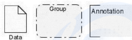
Gambar 5. Elemen Data Object, Group, Dan Annotation

Notasi BPMN diatas dapat memodelkan pesan kompleks yang dilewatkan diantara pelaku bisnis atau bagian dari pelaku bisnis, Salah satu kelebihan diagram BPMN adalah kemampuan dalam memodelkan aliran pesan karena dapat menggambarkan secara grafis pemisahan aliran proses berdasarkan organisasi atau departemen yang melakukannya.